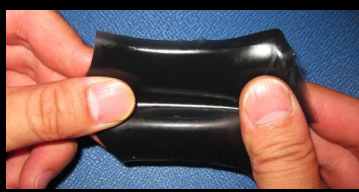
弾性フィルムコート